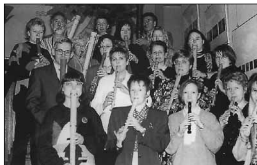
„Veteranen“ der Neuköllner beim Jubiläum

Immerhin, 1954 finden sich schon gute Pressekritiken. 1953 fand auch die erste Neuköllner Block-